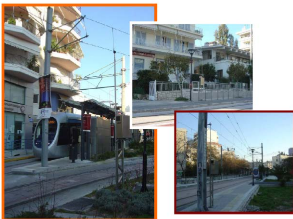
Μόνιμος Σταθμός Παρακολούθησης : Θέση «ΓΟΥΒΕΛΗ»